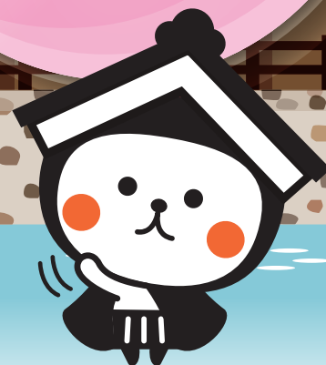
栃木市マスコットキャラクター とち介