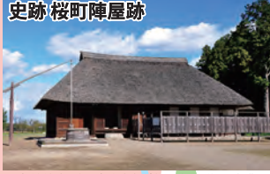
二宮尊徳(幼名・金次郎)が桜町領の復興事業を行った役所跡で、国指定史跡となっています。