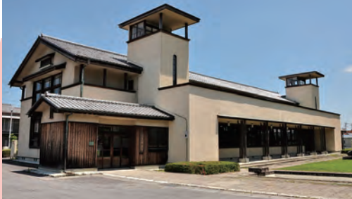
二宮尊徳(幼名・金次郎)が桜町領の復興事業を行った役所跡で、国指定史跡となっています。