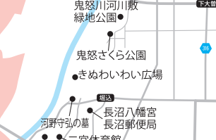
二宮尊徳(幼名・金次郎)が桜町領の復興事業を行った役所跡で、国指定史跡となっています。