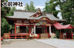
1500有余年の歴史を誇る延喜式内社。本殿などが国の重要文化財に指定されています。