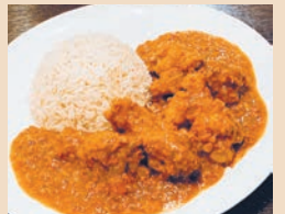
チキンのパブリカクリーム煮 (クジェ・ナ・パブリツェ) ¥1500 (税込)

身がホロホロになるまで、じっくり煮込んだチキンのクリーム煮はミュシャ生誕の地チェコの家庭料理。スパイスを使い日本食にはない味を演出。本国チェコでは、ゆでパン(クネードリキ)が一般的だが、今回はバスマティライスでおためしあれ。