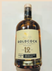
GOLD COCK (ゴールドコック) 12年 ワンショット ¥980 (税込)

チェコ最大級の蒸留酒メーカーR.JELINEK社が伝統の技術と先進的設備を駆使して製造しているウイスキー。相性の良いピザやウインナー等とご一緒に。