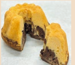
バーボフカ ¥1080 (税込)