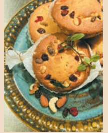
桜草マドレーヌ ¥450 (税込)

ミュシャの作品《桜草》に描かれる女性の髪飾りに見立てた焼菓子。バニラ風味のマドレーヌ生地に、色鮮やかなドライフルーツと作品名にちなみ、桜のフレーバーを効かせて。