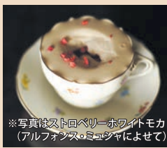
※写真はストロベリーホワイトモカ (アルフォンス・ミュシャによせて)

前期：ストロベリーホワイトモカ (アルフォンス・ミュシャによせて) / 後期：抹茶ホワイトモカ (アルフォンス・ミュシャによせて) 各¥850 (税込)