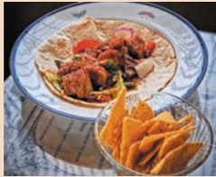
グヤーシュタコス ¥700 (税込)

チェコの一般的な家庭料理、グヤーシュ風にとマトや玉葱、オリジナルスパイスで煮込んだ豚肉をトルティーヤでサンドした、ミュシャ好きな店主が作るすきずきオリジナルタコス。溢れたソースや肉汁をサイドのトルティーヤチップスでディップして食べる二度美味しいカリフォルニアロコスタイル。