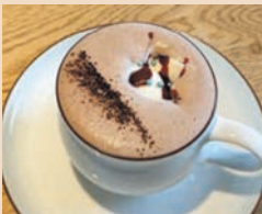
ミュシャ・ショコラ ¥700 (税込)

ミュシャの《ショコラ・イデアル》からインスパイアされて出来たドリンク。甘ずっぱく、だれからも愛されるドリンクは、高級チョコレート「ヴァローナ」ならではの本格的な味わいも楽しめる。見た目も美しいチョコレートドリンク。