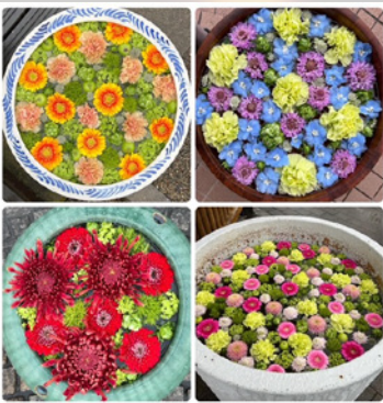
※写真は昨年実施したものです。