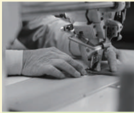
いちひこ帆布 〈バッグ・小物〉