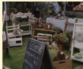
くじらや 〈花・ナチュラルジャンク木工〉