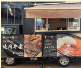
和牛焼肉 雅 〈お弁当〉