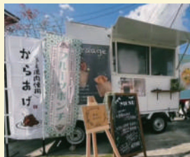
給食キッチンカーkotori 〈唐揚げ・揚げパンなど〉