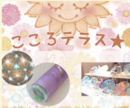
こころテラス☆ 〈グッズ販売・ワークショップ〉