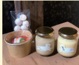
山々と星々 〈プリン・菓子・ドリンク・生活道具〉