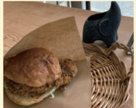
福ぞう商店 〈お惣菜〉