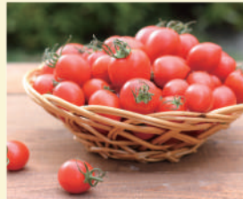
パナプラス 〈ミニトマト〉