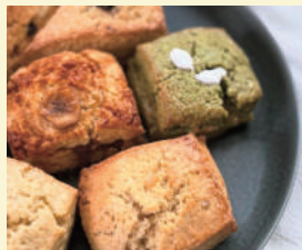
spica cafe+bake 〈焼菓子・ドリンク〉