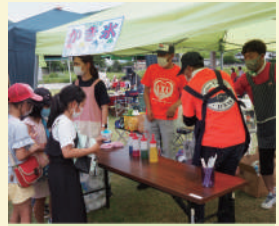
active future 寺尾 〈フランクフルト・かき氷など〉