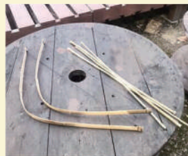
チーム星のプロジェクト 〈竹弓づくりワークショップ〉