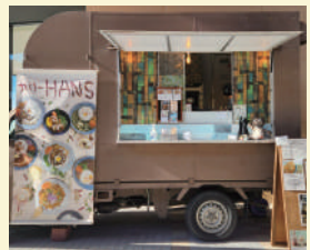
カレーHANS 〈カレー・ドリンク〉