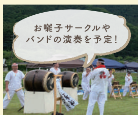
ミュージックエリア